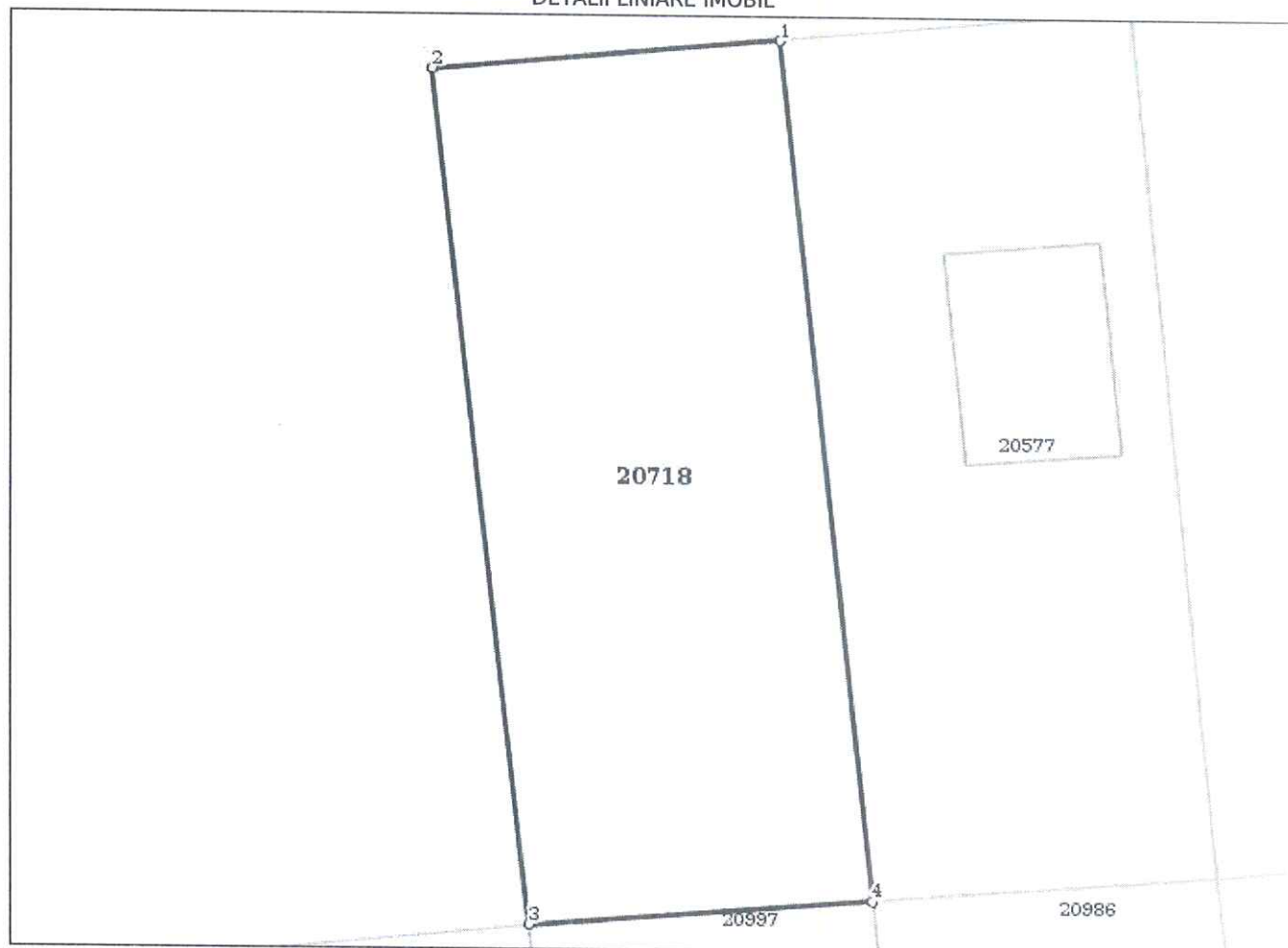
DETALII LINIARE IMOBIL

* Suprafața este determinată în planul de proiecție Stereo 70.